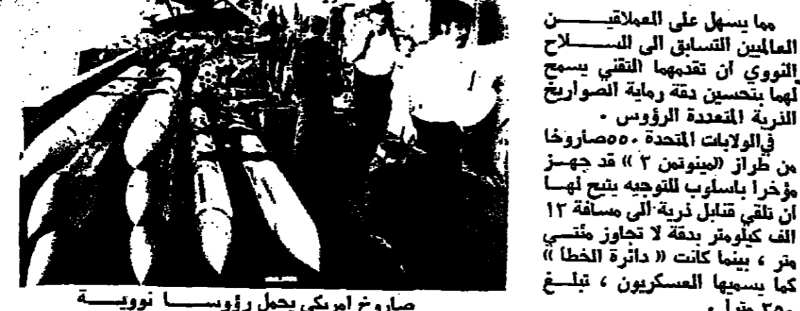
صاروخ امريكي يحمل رؤوسا نووية